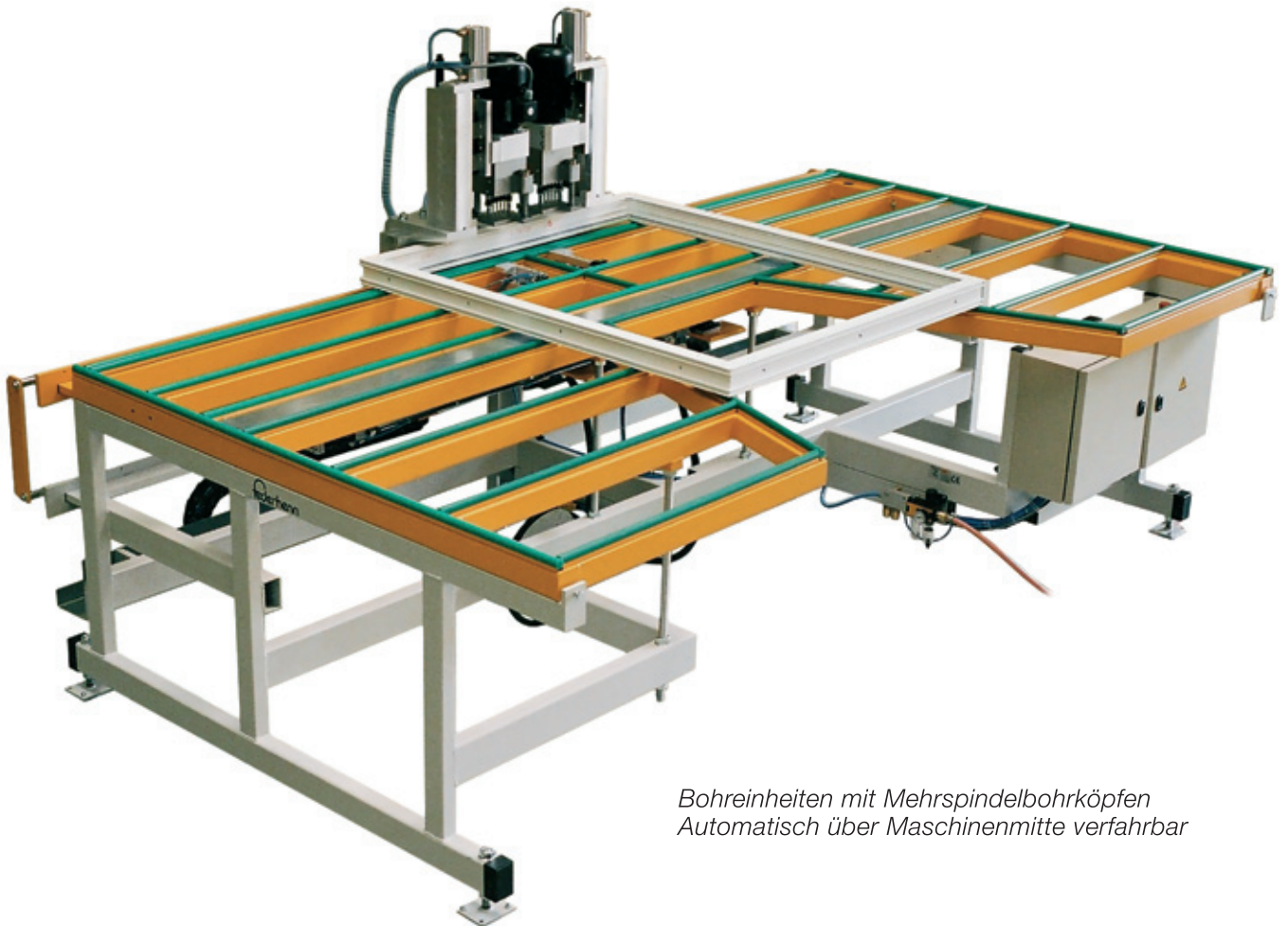
Bohreinheiten mit Mehrspindelbohrköpfen Automatisch über Maschinenmitte verfahrbar

Zum Bohren von Eck- und Scherenlagern mit automatischem Arbeitsablauf, über SPS programmiert.